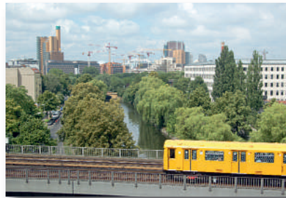
Berlin – vielschichtig und interessant

schungs- und Gedenkstätte Normannenstraße“ (ehem. Amtssitz Erich Mielke), die „Topographie des Terrors“, Gedenkstätte „Berlin-Hohenschönhausen“ und