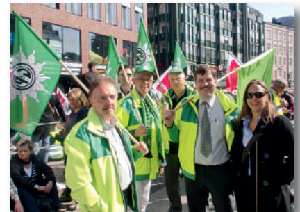
Unsere Unterstützung für die Warnstreikenden!

Klar ist aber, dass er bei den anstehenden Verhandlungen zum TV-L eine große Rolle spielen wird.