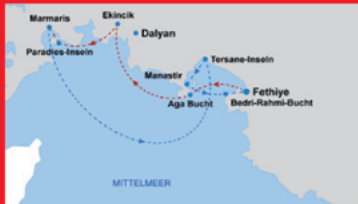
Foto-Workshop auf der MS Grand Admiral