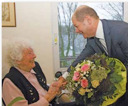
Blumen und ein Lächeln: Bürgermeister Olaf Scholz gratuliert