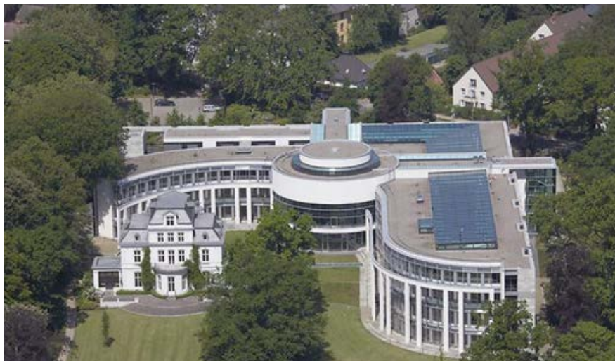
Der Internationale Seegerichtshof

Wir werden eine zweistündige Führung durch den Internationalen Seegerichtshof erleben, der sich auf einem sehr schönen und parkähnlichen Grundstück befindet! Zu erreichen ist der Internationale Seegerichtshof mit der Buslinie ab Hamburg-Altona.