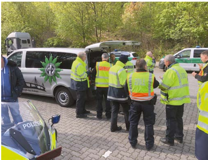
Schlange am GdP-Bus

WIR für EUCH – Euer Fachbereichsvorstand der Wasserschutzpolizei