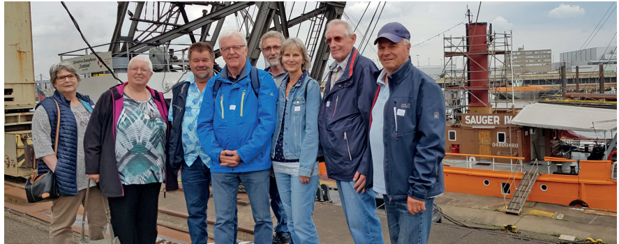
Viel zu sehen, viel zu bestaunen: die Teilnehmer des Ausflugs

Zunächst konnten wir auf einem Foto (Luftaufnahmen) des Hamburger Hafens aus dem Jahre 1938 mit einem Foto aus dem Jahre 1962 mit all den Veränderungen der Zeit vergleichen. Unser Guide erzählte uns anschaulich von der Beladung eines Stückgutfrachters mit seinen fünf bis sechs Ladeluken, seinen Scherstöcken im Zwischendeck mit Lukendeckel aus Holz, teilweise eigenem Ladungsgeschir und den Ballasttanks. Es war alles schwere körperliche Arbeit im Gegensatz zu den heutigen großen Fracht- und Containerschiffen. Wo früher drei Stückgutfrachter hintereinander lagen, könnte heute lediglich ein Containerschiff liegen, vorausgesetzt die