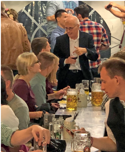
Aufmerksam und interessiert: Bürgermeister Dr. Tschentscher

Man ist doch immer wieder erstaunt, wie sehr sich bayrisches Brauchtum auch in Hamburg pflegen lässt. Und dies bereits Anfang September bei bestem Wetter und prominentem Besuch.