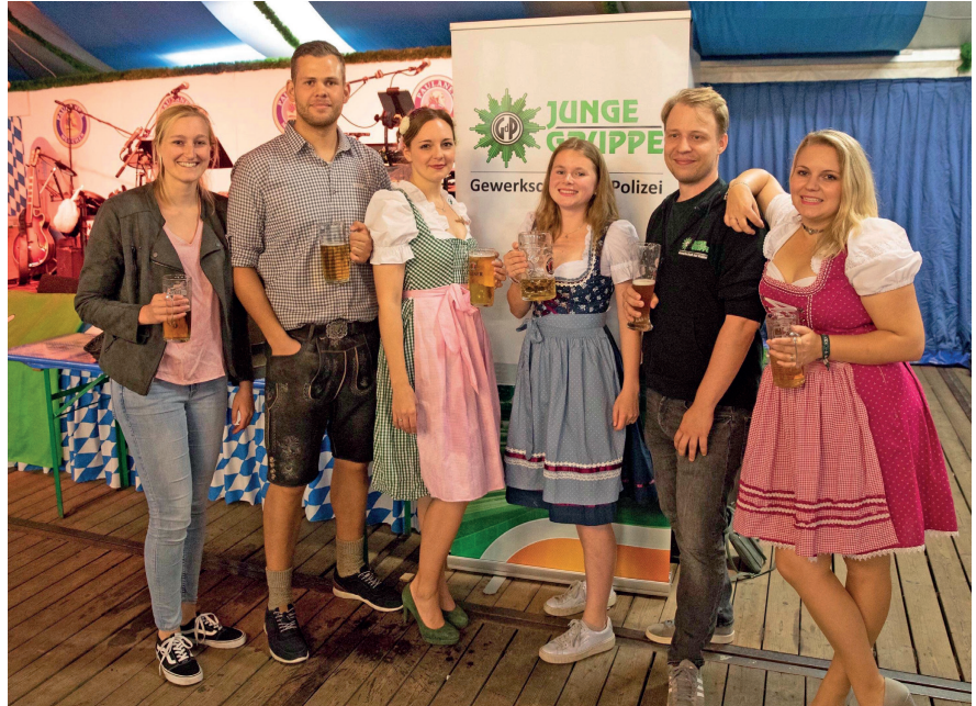
Die JUNGE GRUPPE, Organisation in den besten Händen

Das zweite Oktoberfest der GdP Hamburg war erneut ein Anziehungspunkt für viele Kolleginnen und Kollegen. Zumeist in Tracht und dazu viel Spaß und Freude konnte die JUNGE GRUPPE der GdP Hamburg weit über 500 Gäste im Festzelt von